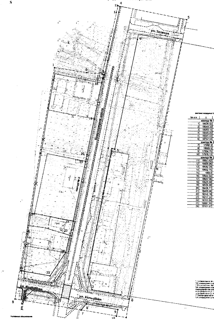
Наименование территории установленного образца

Чертеж красных линий территории для размещения линейного объекта- автомобильной дороги по ш.Новотроицкое от ул.Кольцевая до ул.Зеленая города Благовещенска